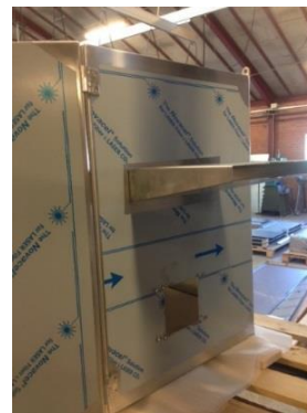
Papirudfaldsbakke med let adgang.